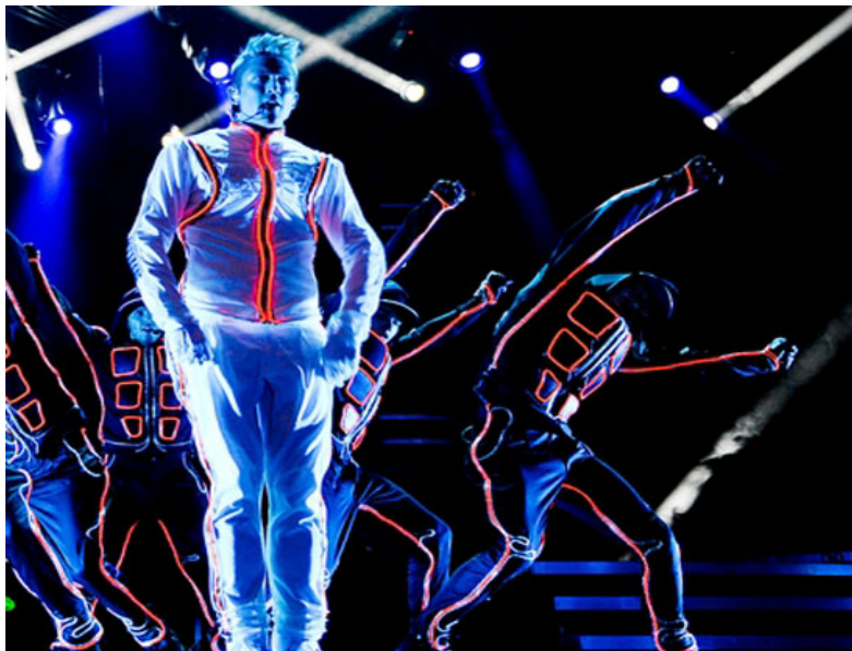
Danny Saucedo, Melodifestivalen 2012