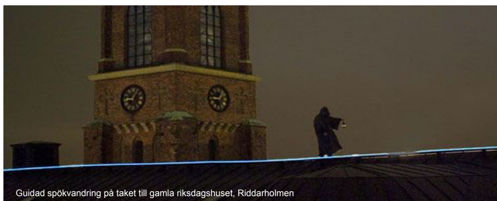
Guidad spökvandring på taket till gamla riksdagshuset, Riddarholmen

Visa vägen. I ur och skur, och genom rök och dimma. För brandmyndigheten är driftsäkerhet och funktion i extrema situationer en viktig fråga. Eftersom vår ljustråd inte innehåller glödlampor eller andra känsliga delar som kan gå sönder så används den i en allt ökande omfattning som ledbelysning i tunnlar och nödutgångar. LEC-ljuset absorberas inte lika lätt av rök och dimma som traditionell punktbelysning, och kan visa vägen i flera kilometer om så önskas.