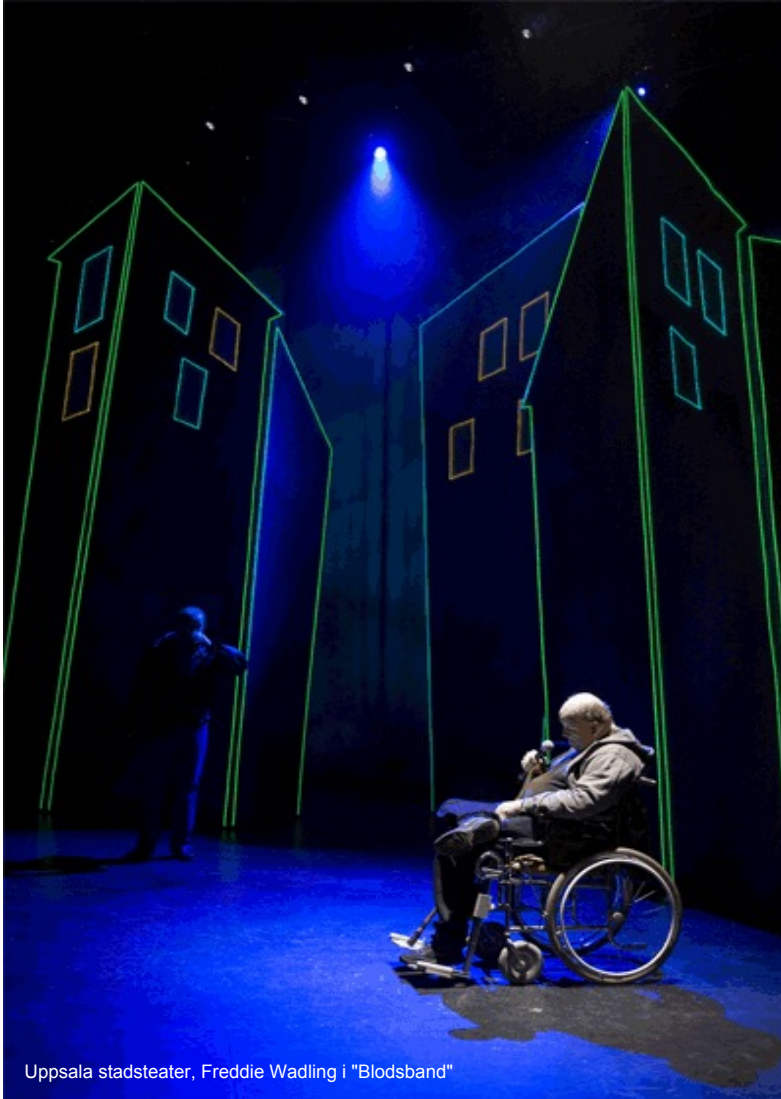
Uppsala stadsteater, Freddie Wadling i "Blodsband"