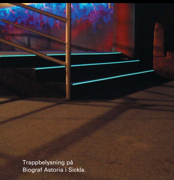
Trappbelysning på Biograf Astoria i Sickla.